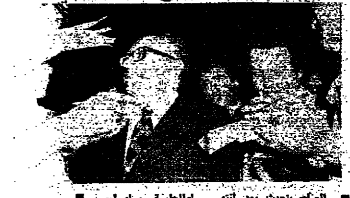
الملك يصطحب بعد انتهائه الجلسة مساء أمس

انفجرت الحكومة أمس في مجلس الوزراء عندما استقال وزير الكتائب السيدان اويس ابو شرف وجورج سعادة وقدمان معها في الاستقالة وزراء الاحرار السادة محمود عمار وتيم تيم وميخائيل سامان، ووزير الصحة ابراهيم جراد - امساً. الرئيس فرنجية اتصل عند انجمن مستقلى الحكومة حتى صباح غد الجمعة لاجراء المخرج المناسب، وحسبى لا تنسر استقالته نتيجة لضغط من الكتائب. وجاء انفجار الوضع الوزاري قبل ساعتين من موعد جلسة مجلس الوزراء التي انعقدت في الساعة السابعة والرابع مساء برئاسة الرئيس سليمان فرنجية - فقد اتخذ المكتب السياسي للكتائب في اجتماع سرى عقده بعد ظهر امس قراراً هائلياً باستقالة وزيريه من الحكومة، وجرى اتصال مع الرئيس كميل شمعون تصيح بالتفوي لكتفه اعلان تضامنه مع الكتائب في حال اصرارها على الاستقالة - كما جرى اتصال مع الابير مجيد ارسلان. وعندما وصل وزير الكتائب السيد القصر ابغوا وزراء الاحرار قرارهما، فالتص الوزير محمود عمار بالرئيس شمعون الذي ابلغه ضرورة التضامن بين الكتائب والاحرار وحفاظهما في كل موقف.